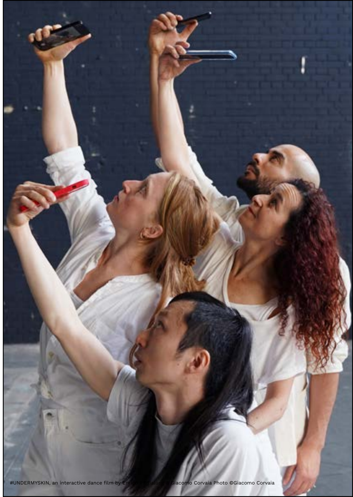
#UNDERMYSKIN, an interactive dance film by Enrico Paglialunga & Giacomo Corvaia