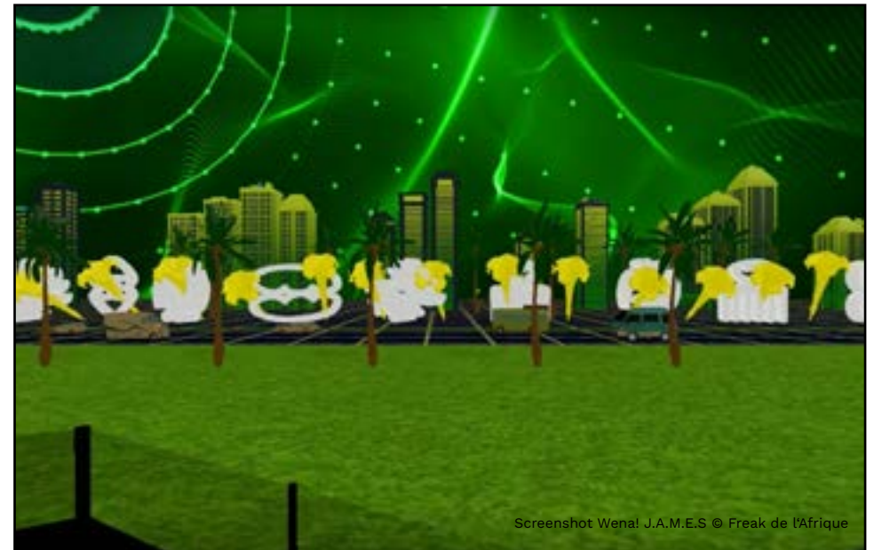
Screenshot Wena! J.A.M.E.S.