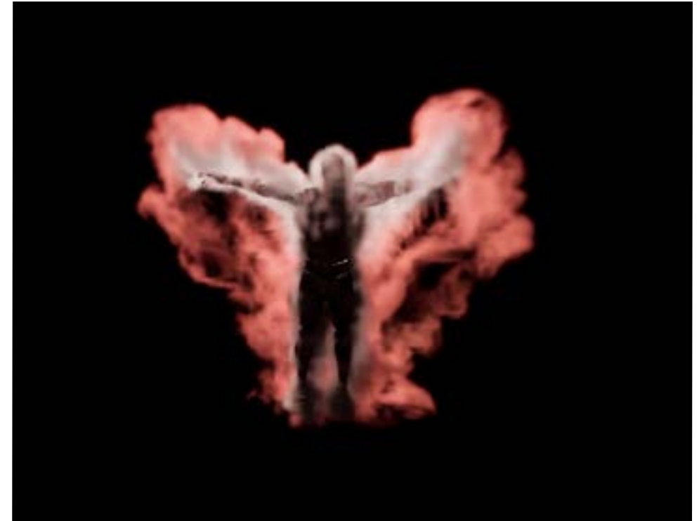
interactive installation on movement Nr. 1 ©Jens Blank